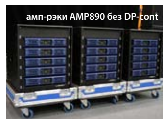
амп-рэки AMP890 без DP-cont

пользователей продукции Turbosound. Благодаря появлению этой серии традиционное качество Turbosound стало доступно и в бюджетном секторе рынка. Серия включает четыре широкополосных кабинета, четыре сабвуфера и два сценических монитора. Традиционная компоновка сателлит на штативе плюс сабвуфер, предлагает практически неограниченный простор для деятельности: выездные концерты, репетиционные базы, туры по небольшим залам, дискотеки и т.д. Благодаря мощному звуку эта серия пользуется особым спросом у ди-джеев, нуждающихся в собственном мобильном звуковом аппарате. Серия TCS-Compact – это еще одна новинка Turbosound. В серию входят четыре широкополосных, широкополосные потолочные АС, и четыре басовых кабинета, способных обеспечить надежную работу в самых разных условиях: от небольших баров до крупных танзалов и дискотек. Относительно невысокая стоимость громкоговорителей TCS-compact при проверенном надежном качестве Turbosound вполне может сделать их новым лидером своего сектора рынка. Акустические системы TCS-compact комплектуются разнообразными крепёжными элементами, что