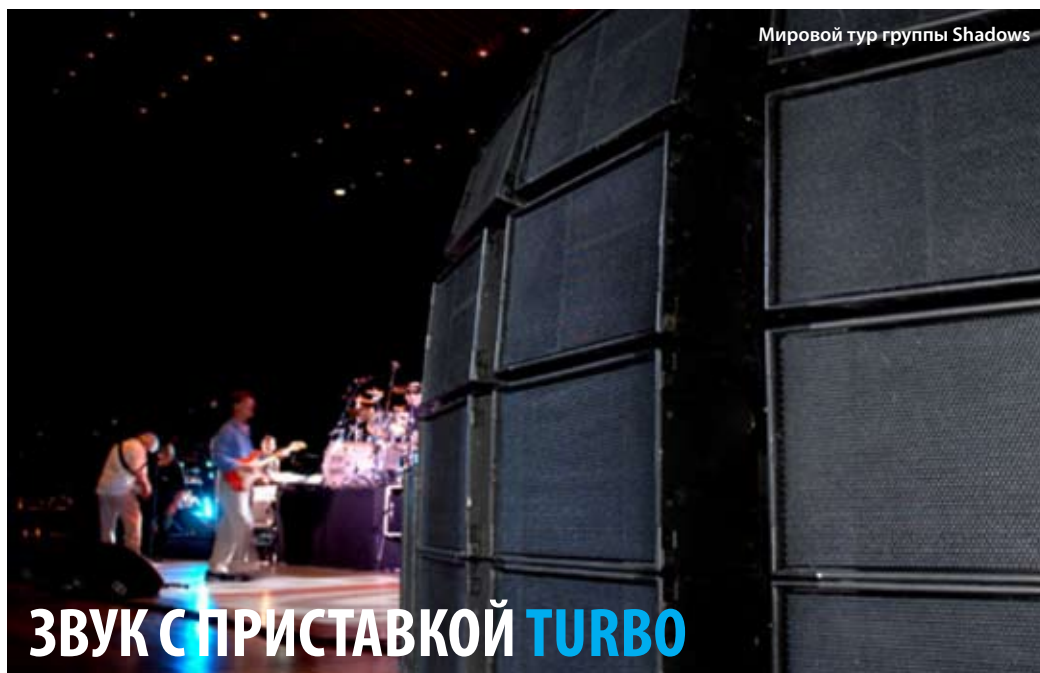
Мировой тур группы Shadows